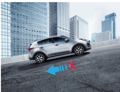
Control de asistencia de ascenso (HAC*)