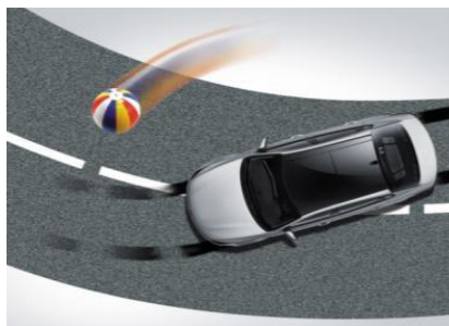
Sistema de frenos antibloqueo (ABS*)