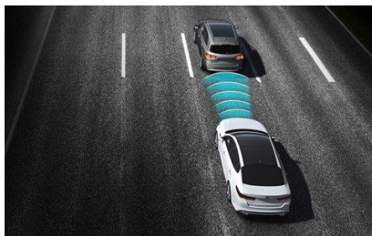
Sistema de alerta contra colisión delantera (FCWS*)