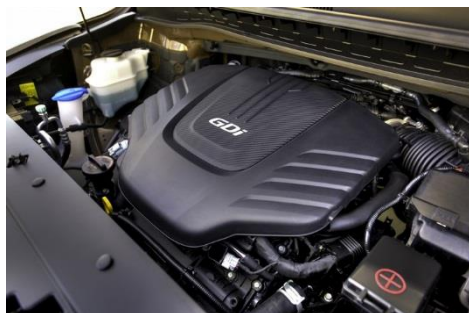
Motor con Tecnología GDi